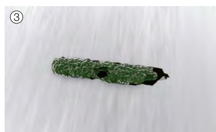
③ El germen muere.