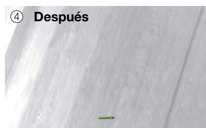
④ Después Se ha reducido notablemente la concentración de gérmenes en la superficie.