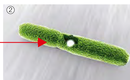
② Los iones de plata destruyen las membranas celulares de los gérmenes.