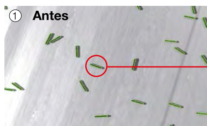
① Antes Alta concentración de gérmenes en la superficie.

La superficie SecuSan® mantiene su eficacia incluso si se limpia regularmente